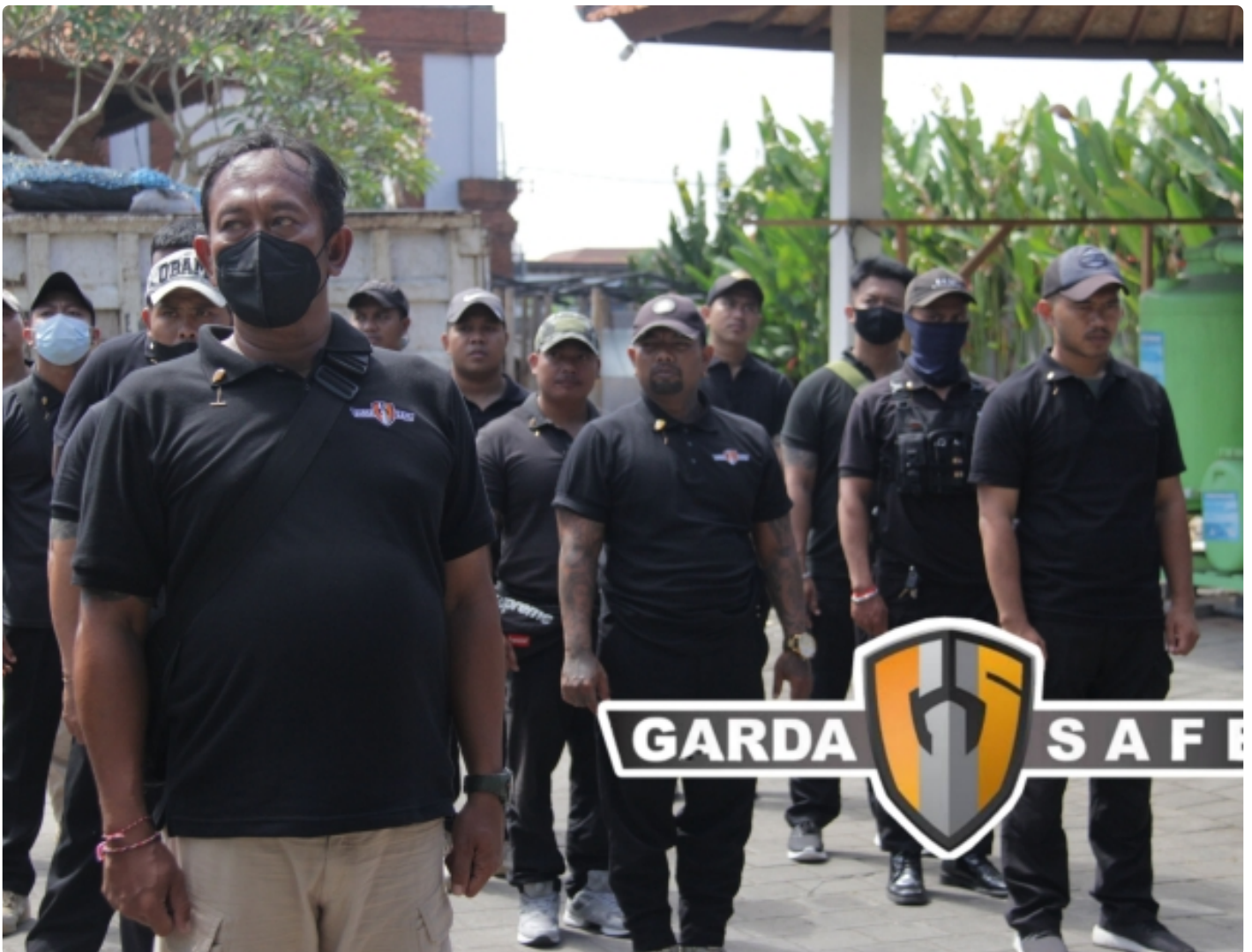
Briefing dan apel Garda Safe Security

BADUNG - Pengamanan untuk sebuah konser musik merupakan kondisi vital yang harus benar-benar diperhitungkan oleh panitia penyelenggara sebuah konser, apalagi mendatangkan penonton sampai ribuan orang. Disamping izin keramaian dari desa setempat, kepolisian dan unsur pengaman desa, juga perlu khusus penjagaan yang profesional.